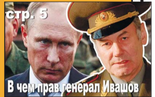
стр. 5 В чем прав генерал Ивашов