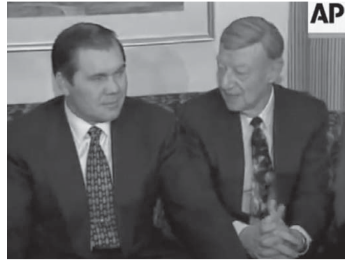
Александр Лебедь и Уильям Рот

И хотя его популярность обеспечила ему уверенное третье место в опросах общественного мнения и, на короткое время, должность главы национальной безопасности в администрации Ельцина,