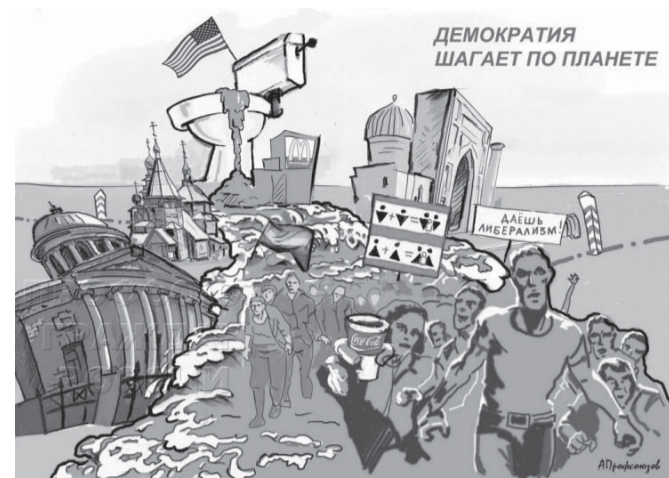
ма) и УП «выиграл-проиграл».

Капиталистическая общественно-экономическая формация (далее – КОЭФ) – это обобщающее название всей совокупности моделей, начиная от чисто капиталистической и заканчивая социалистической. Все эти модели базируются на технологиях 3-5-го укладов, характеризуются лишением всех индивидуумов из УП (управляемая подсистема) прав на безусловное удовлетворение витальных потребностей и подмене демократии олигархическим принципом взаимодействия РП (руководящая подсистема)