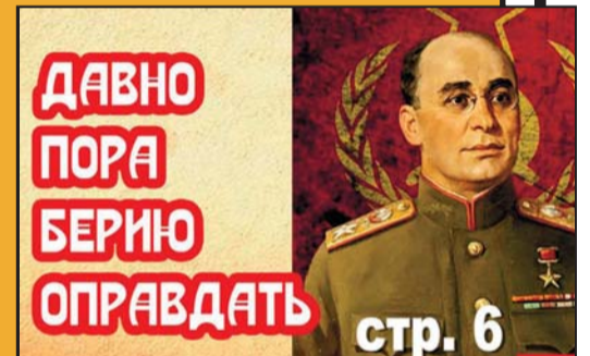
ДАВНО ПОРА БЕРИЮ ОПРАВДАТЬ стр. 6