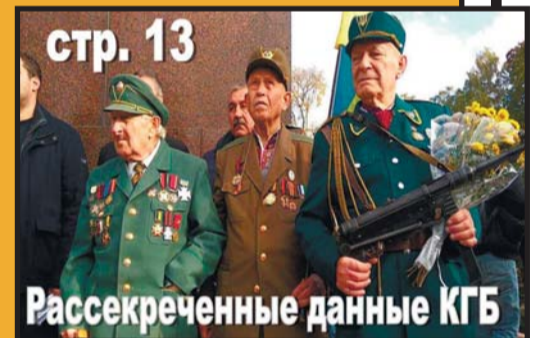
стр. 13 Рассекреченные данные КГБ